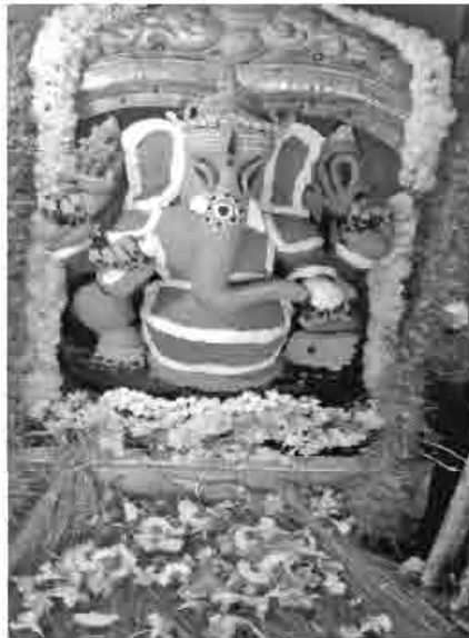
சுந்தர கணபதியின் அலங்காரம்