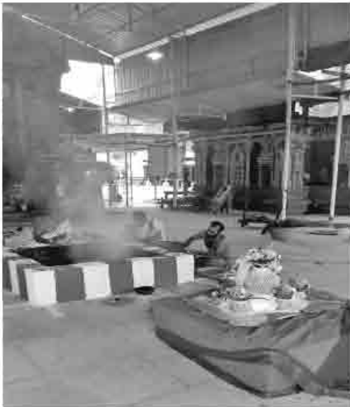
குரு பெயர்ச்சி ஹோமம்