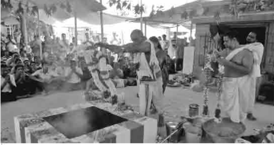
பூர்ணாஹுதி செய்யும் காட்சி