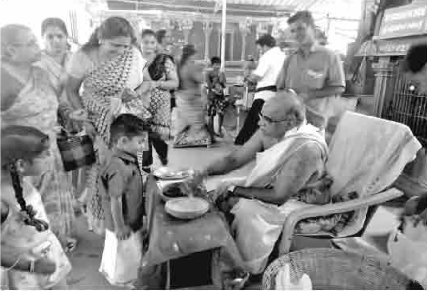
குருஜி பிரசாதம் அளிக்கும் காட்சி