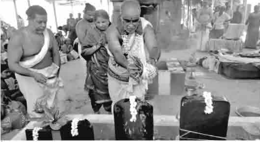
குருஜி அவர்கள் நாக பிரதிஷ்டையின் அபிஷேக காட்சி